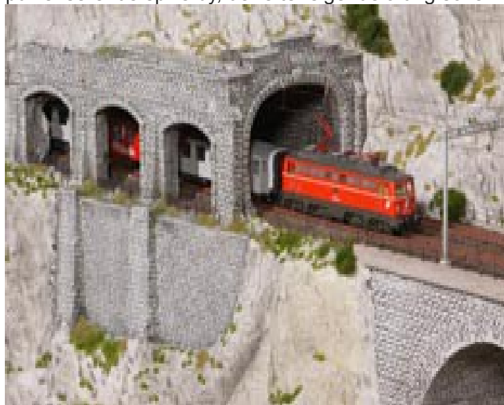
Et lille tunnelpas i Schweiz.

Til Italien med Rom, hvor paven står på balkonen og holder sin påsketale til de mange tusinde mennesker på Peterpladsen. Videre rundt i den store by til Colosseum og det verdensberømte Anita Ekberg badekar "La Dolce Vita Fontæne di Trevi Scena" . Ikke kun dele af Europa er med i Wunderland, men store dele af USA med det vilde vesten, Grand Canyon, Las Vegas, hvor man virkelig får et godt indtryk af den farverige og spektakulære pulveriserende spille by, der efter sigende aldrig sover.