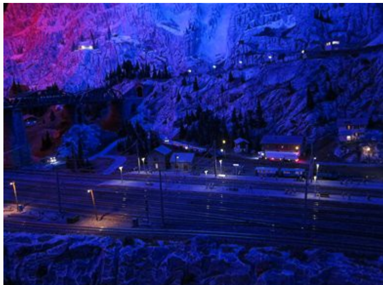
Så blev det nat. Tusindevis af små lamper bliver tændt rundt om.

Efter ankomsten til Hamburg gik vi i silende regn til vort hotel ca. 15 minutters gang fra Hovedbanegården. Vi kunne først få vore værelser kl. 15:00, men fik tildelt et værelse, hvor vi kunne sætte bagagen og blive "nursed" lidt efter den ellers meget behagelige togoplevelse med et IC3-tog fra DSB. Vi begav os til Wunderland, hvor vi må vente i 2 timer for at komme til, da der var fyldt med mennesker. Vi benyttede ventetiden til at få lidt at spise i en af de to restauranter. Endelig blev det vores tur, hvor vi vandrede rundt, som var vi på rundtur i et Ikea varehus. Indtrykkene var imponerende og mange små bitte detaljer skulle studeres nærmere, så tiden fløj afsted og før vi fik set os om, så var der gået over tre timer og vi nærmede os lukketid kl.20:00. Vi vandrede hjem til hotellet og fik efter en kort stund gjort os klare til aftensmaden, som blev indtaget på en Ibis restaurant lige over for vort hotel, hvor der kun var morgenmad. Vi var et godt sammentømret hold, der alle var godt sultne og tørstige, hvilket kokken var særlig glad for, da vi alle bestilte Wienerschnitzel med de verdensberømte tyske "Brat kartoffeln".